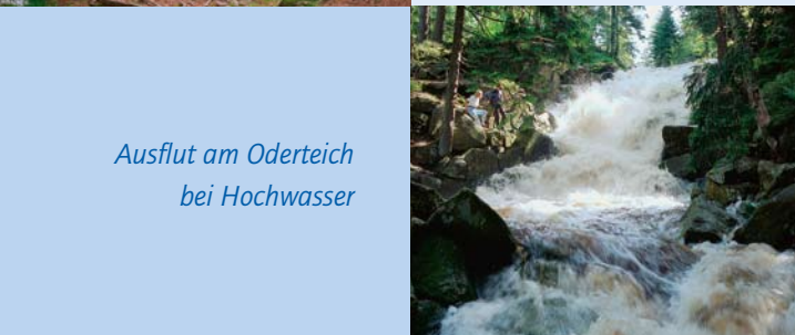
Ausflut am Oderteich bei Hochwasser