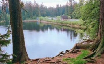
Das Wasser des Oderteichs treibt noch heute Wasserkraftwerke an